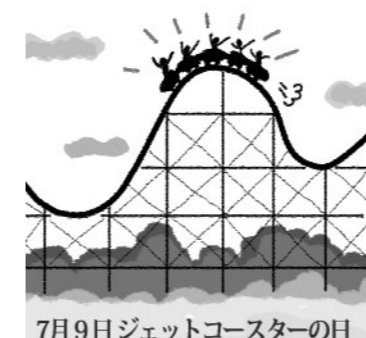
7月9日ジェットコースターの日