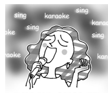
1月19日 カラオケの日

1月19日は「カラオケの日」です。歌詞を見ながら声を出したり、伴奏に合わせて歌ったりするのは、脳にもいいこと。また、歌を歌うことで、感じる、幸せホルモンの「オキシトシン」が分泌されることになり、心もほぐれ、ストレス解消になります。