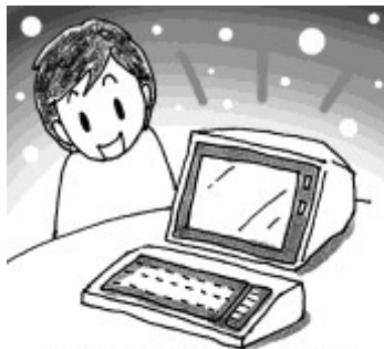
9月28日パソコン記念日

一九七九年(昭和五十四年)のこの日、日本電気株式会社(NEC)がパーソナルコンピュータ「PC-8000」(PC-8000シリーズ)を発売しました。キーボードと本体が一体化したデザインで、サイズは430(幅)×260(奥行)×80(高さ)ミリメートル、重量は4キログラム、定価は十六万八千円でした。これがパソコンブームの火付け役となり、PC-8000シリーズは三年ほどで約二十五万台を売り上げました。同社を代表するシリーズの一つとなり、その後も数多くのソフトウェアや周辺機器が販売され、日本だけでなく外国でも人気となりました。