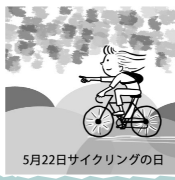
5月22日サイクリングの日